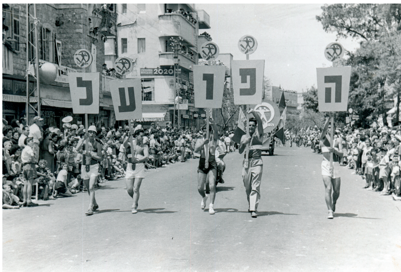
חברי הפועל חיפה לקחו חלק נכבד בתהלוכות ה-1 במאי בעיר

פרישתו המשיך לטפל ביסודיות ב"כיתות המחול", ב"בית הספר הרוקד", וכן באירועים ובכנסים של בתיה"ס שהיו פרי יצירותיו בתקופת עבודתו במערכת. שלום חרמון הניח את היסודות לריקודי העם בחיפה, וגם היום נהנים מפרי עמלו. הוא גיבש צוות מסור להדרכה, ולעיצוב מודלים לערבי ריקודי עם, הרקדה המונית בשבתות בחוף הים וחוגים לריקודי עם ולריקודי עמים. בשלהי שנות ה-60 ובתחילת שנות ה-70, עם ירידת קרנו של הסניף החיפאי, בעיקר מפאת היעדר תקציב מינימלי להפעלת החוגים והלהקות, קלטה עיריית חיפה את להקות המחול, את החוגים לריקודי עם ואת "ערבי ריקודי העם" שעברו לבית רוטשילד, והפכה אותם לבני טיפוחיה.