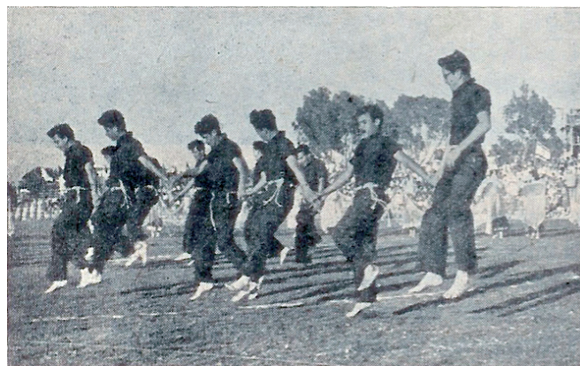
וגם הבנים יוצאים במחולות

ממגוון הפעילויות שתוארו בפרק זה עולה תרומתו החברתית והתרבותית החשובה של הפועל, בעיקר בראשית דרכו בתקופת המנדט הבריטי ובשנותיה הראשונות של המדינה. השילוב של חינוך גופני לעובד, ספורט, תרבות וחברה הביא את הפועל חיפה להיות מועדון הספורט הגדול ביותר בעיר הכרמל בשנות ה-50, ה-60 וה-70. לקראת סוף שנות ה-70 ובראשית שנות ה-80 של המאה הקודמת, חלה שחיקה במועדון מפואר זה. חלק גדול מהמחלקות הועברו לסניפים ברשויות המקומיות במרחב. מחלקות אחרות נסגרו מחוסר תקציב או מכיוון שהספורטאים עברו למקומות אחרים (הדוגמה הבולטת הינה המחלקת לאתלטיקה קלה), ובכך גם באה כמעט לקצה תרומתה התרבותית של הפועל מעבר לתחום הספורט ה"טהור".