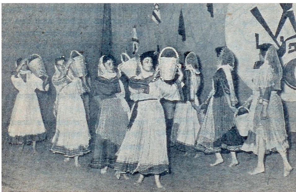
הבנות בלהקת הפועל חיפה בריקודי עם

שלום חרמון המשיך לקדם את ריקודי העם והמחול העממי, הן כמורה במכללה למורים לחינוך הגופני בווינגייט והן בתפקידו בפיקוח. בשנת 1968 התמנה שלום חרמון כמפקח מרכז, ונמנה עם אלה שהרימו תרומה גדולה במיוחד לפיתוח המחול בארץ. הוא אף הוסיף מחולות מפרי יצירתו, ופרסם מאמרים רבים. בשנת 1980 הוא פרש לגמלאות ועם