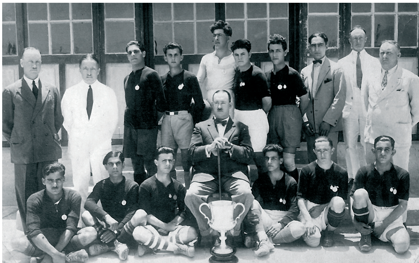
פועלי הרכבת בחיפה, במשחק נגד האנגלים - 1927

על פי תפיסתה של הפועל בעת הקמתה, היה הספורט כלי שרת לבריאות העובד ואמצעי לליכוד מעמד העובדים. ההישגים לא היו המגמה העיקרית, אלא תיקון הפגמים הנגרמים לגוף האדם בעבודה וכן הקניית ערנות, שתשמור