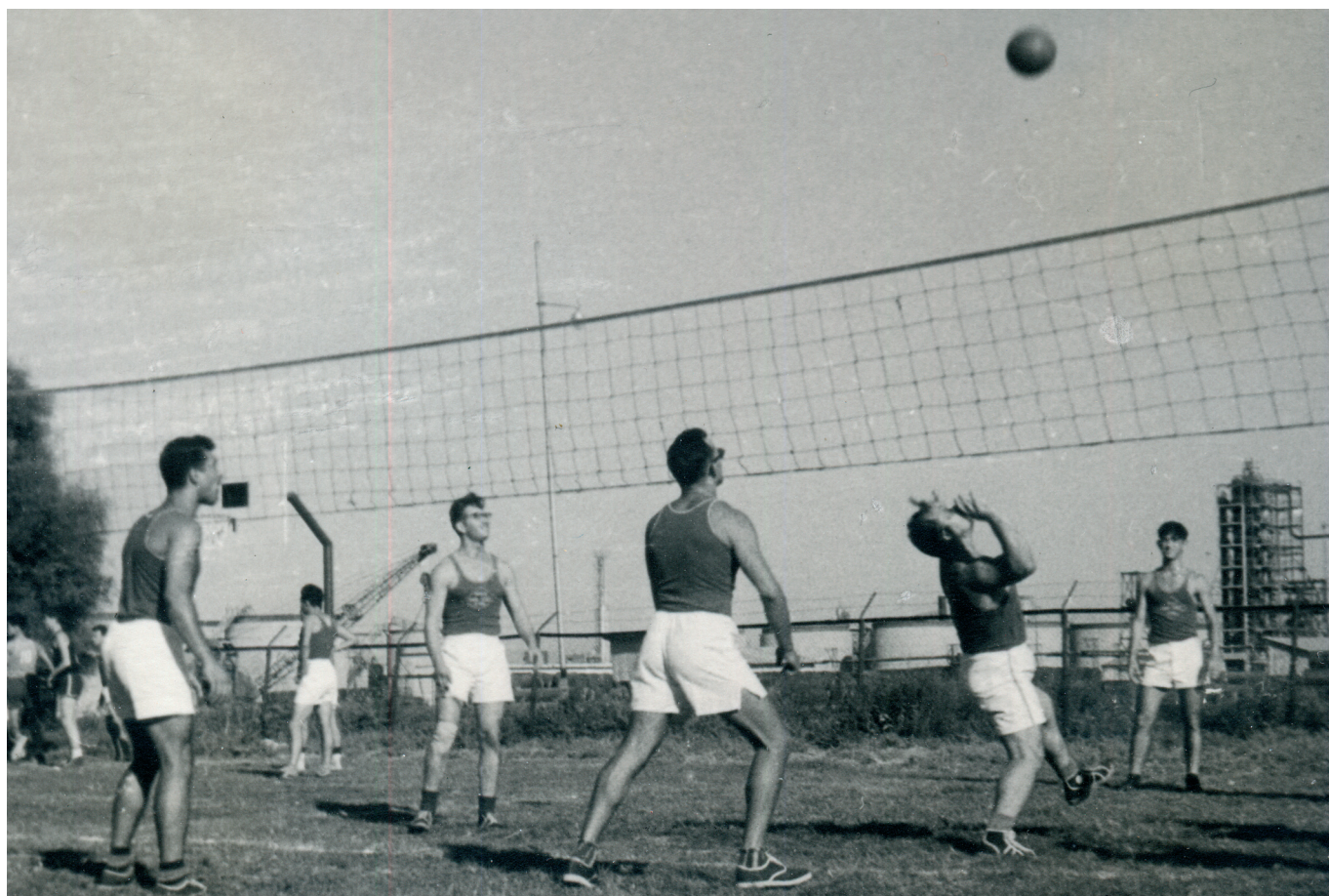
משחק כדורעף במסגרת הליגה למקומות עבודה

מראשית ארגון הפעילות במקומות העבודה התעוררו שתי בעיות "תקניות". הבעיה הראשונה הייתה האם לשתף בקבוצות המתחרות (בעיקר כדורגל) חברים המשחקים בקבוצות המשותפות להתאחדות לכדורגל; הבעיה השנייה הייתה - מה דינם של ספורטאים, העובדים במקום שמתקיימת בו פעולת הפועל, אולם הם חברים בארגוני ספורט אחרים (מכבי, בית"ר וכו'). לגבי הסוגיה הראשונה הוחלט לצמצם בהדרגה את מספרם של הספורטאים המאוגדים בהתאחדות לכדורגל (שהרי המטרה הייתה להעסיק בספורט את אלה שאינם עוסקים בו, ולא ליצור התמודדות בין ספורטאים פעילים, כדי ל"האדיר" את שמו של מקום העבודה). ברם, הותרה השתתפותם של ספורטאי אחד או שניים, שיהיו את גרעין ההתארגנות. לגבי הסוגיה