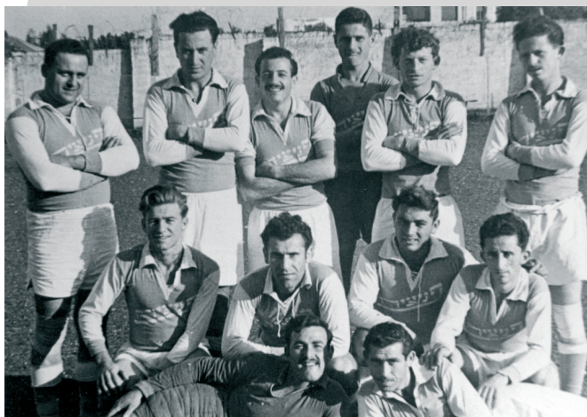
קבוצת הכדורגל של בית החרושת פניציה