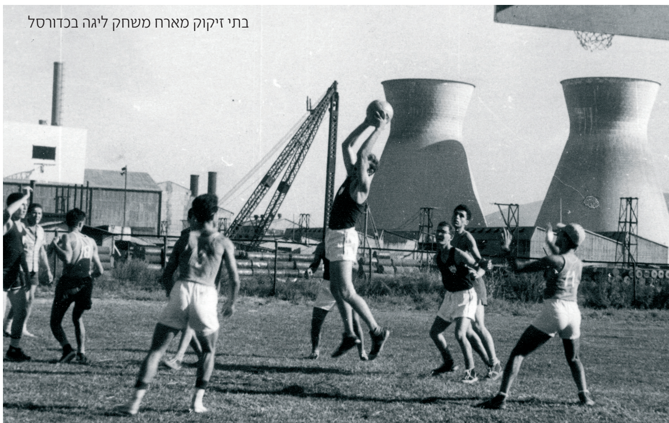
בתי זיקוק מארח משחק ליגה בכדורסל