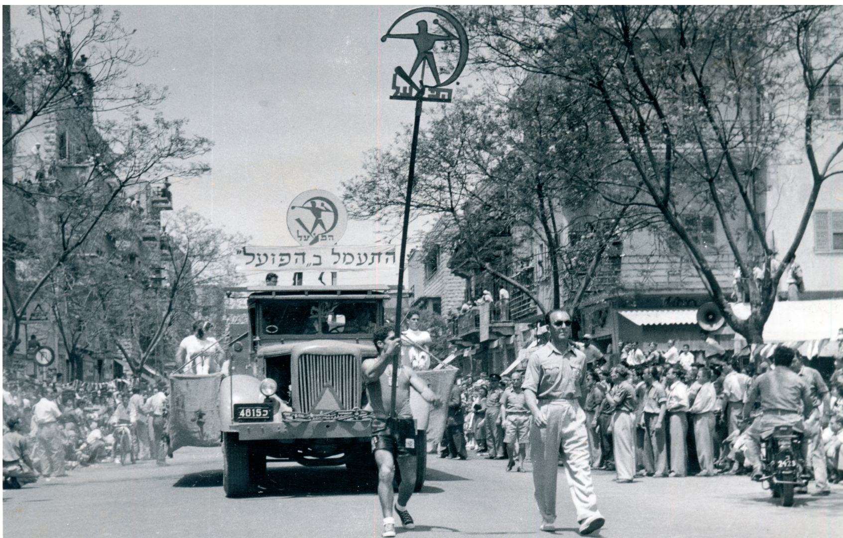
פועלי הנמל במצעד 1 במאי 1958

בשנת 1999 הקים יגאל כהן, עם מספר חברים, את העמותה למחלקה למקומות עבודה, שאושרה על ידי מזכירות מועצת פועלי חיפה. הוא המשיך להוביל את המחלקה לספורט