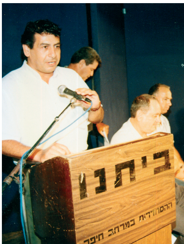
במקומות העבודה בעזרת צוות אנשים מסורים ובאמצעות תקציב מאוון לשביעות רצונם של כל הגורמים.